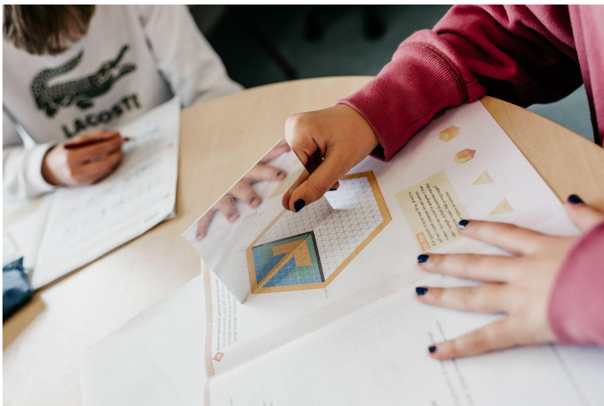
Schoolvereniging Peetersschool, Amsterdam